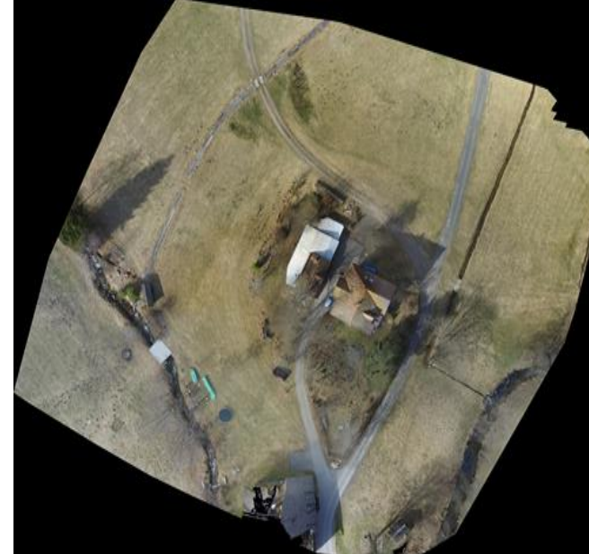
Haus an der Säge, Menzenschwand (Alemania)

Este tipo de trabajo permite tener una vision global de la obra para poder llevar un control más exhaustivo del avance de la misma, desviaciones, documentación de modificaciones y registro temporal de actuaciones realizadas durante la obra.