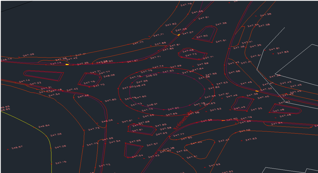
Proyecto Käppellenmate en Denzlingen (Alemania)